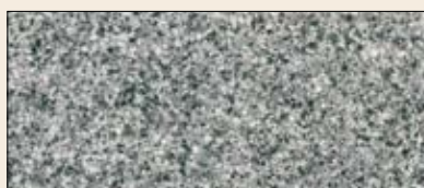
št. 32M, 332M