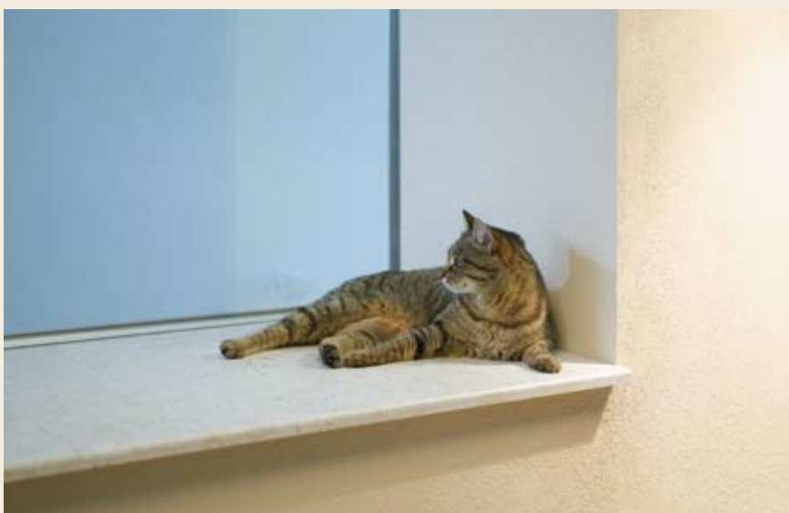
Vedno topla in vsestranska: helopal kot okenska polica, namenjena tudi sedenju