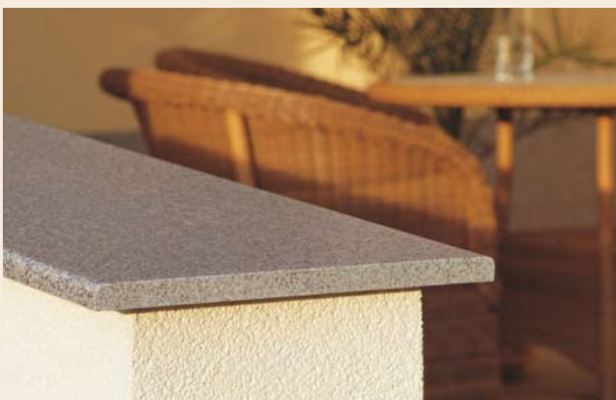
Z dolgo življenjsko dobo in odporna na vremenske vplive: helopal kot parapetna polica