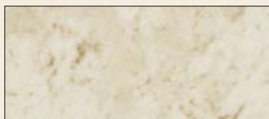
št. 91, 391, 391M