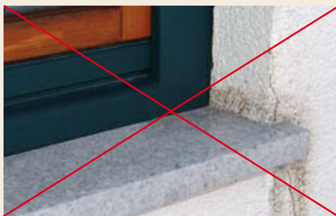
Narobe vgrajena okenska polica