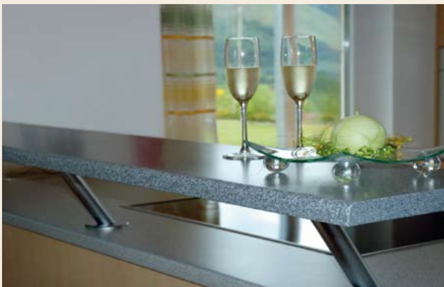
Privlačno in enostavno za vzdrževanje: helopal kot točilni pult