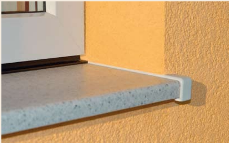
s helopal kontakt s trojno zaščito

Uspešno opravljen test o neprepustnosti vode na Institutu za okensko tehniko Rosenheim po DIN EN 1027 (št. certifikata 32024448).