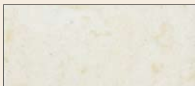
št. 10, 10M

Vse helopal proizvode dobavimo najkasneje v sedmih delovnih dneh.