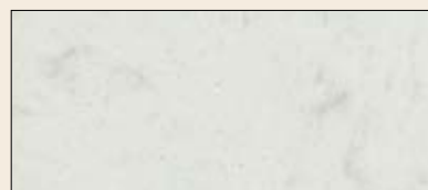
št. 18, 318, 318M