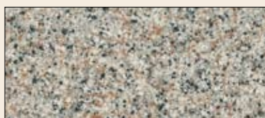
št. 36, 336